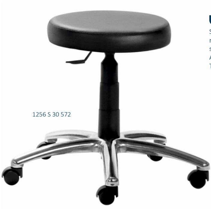
1256 S 30 572